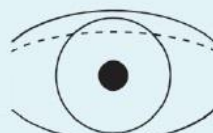
Exempel på ögonlockposition